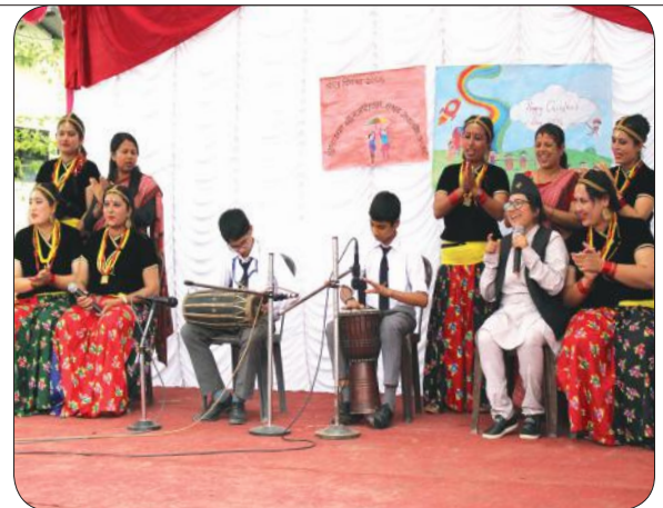
Teachers Dohori on Children's Day