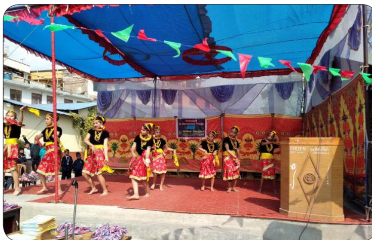
Glimpse of Cultural Dance Competition