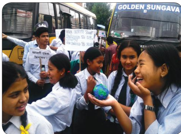
World Environment Day