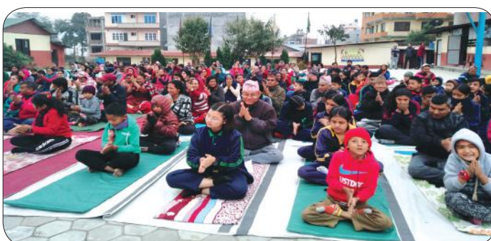
Yoga Session in School