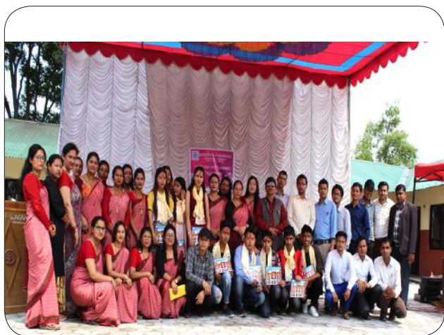
SEE Farewell Session