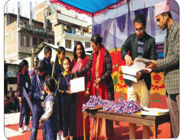
Sports Meet's Prize Distribution