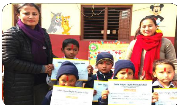
Pre-Primary Prize Distribution