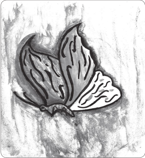
Aastha Shrestha, Class-10