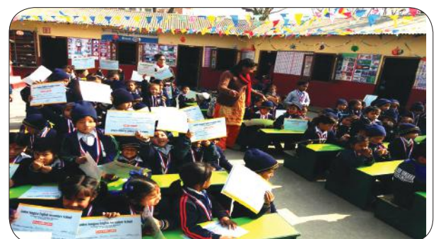
Pre-Primary ECA Prize Distribution