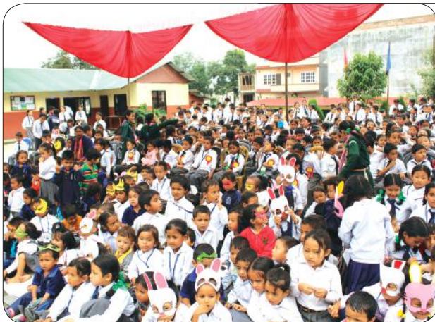
Children's Day Celebration