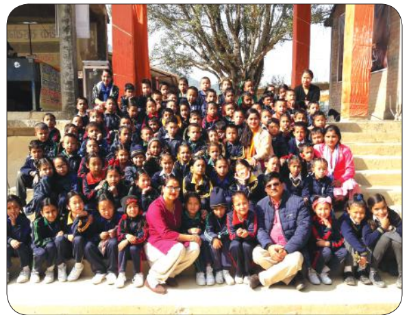
Excursion Class 1,2