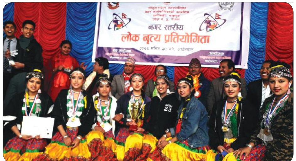
Municipality Wide Dance Competition Winners -2076