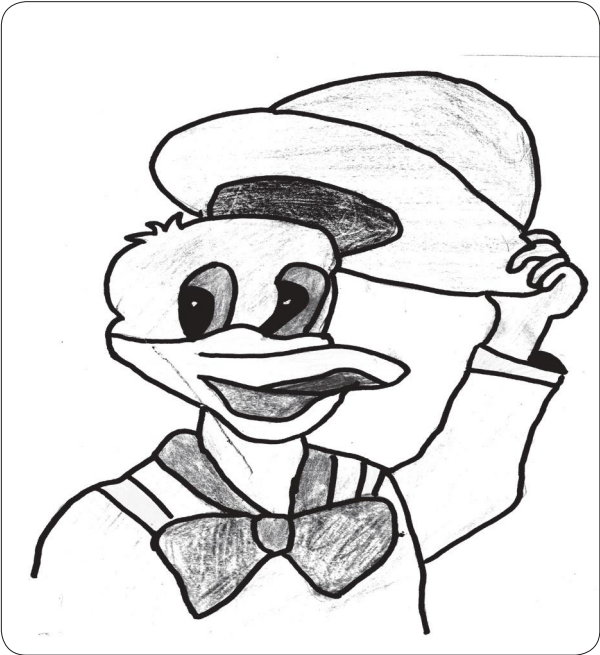
Bijaya Chaulagain, Class-6