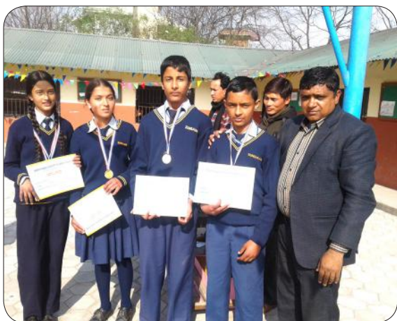
Quiz Competition Winners