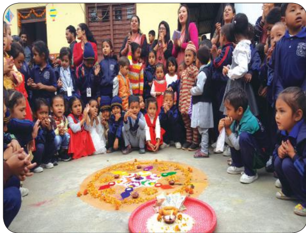
Deusi Bhailo Program-2076