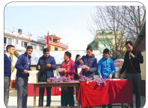
ECA Prize Distribution