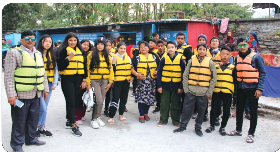
Class IX Tour Pokhara and Lumbini