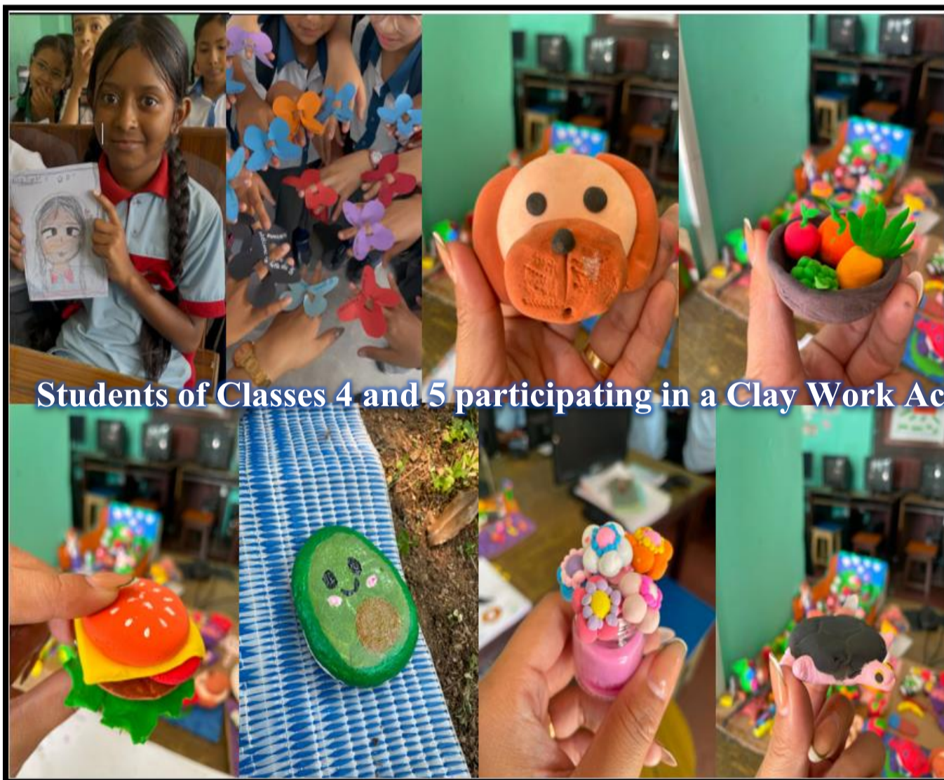
Students of Classes 4 and 5 participating in a Clay Work Activity conducted by Hina Miss.