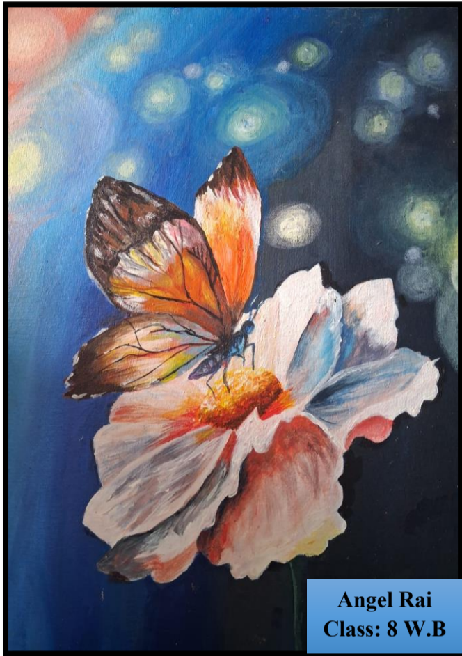
Angel Rai Class: 8 W.B